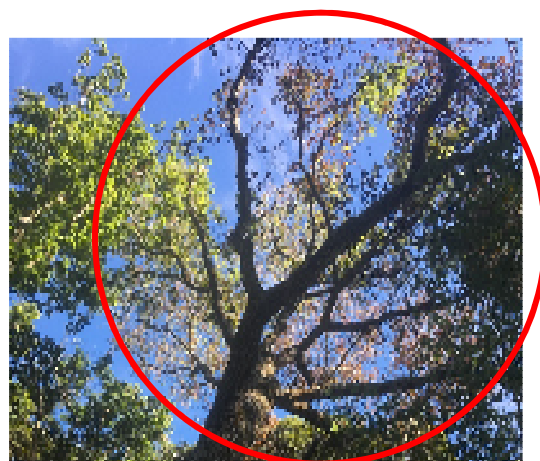
カシノナガキクイムシの被害を受けたコナラの枯れ木