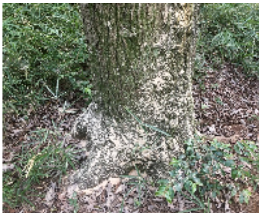
カシノナガキクイムシが木の中に入り込み、大量のフラス（木くず）が出ている状況

被害を受けた木が倒れてきたり、枝が落ちてくる危険性がありますので、枯れた木の近くを通る時は、十分に注意してください。